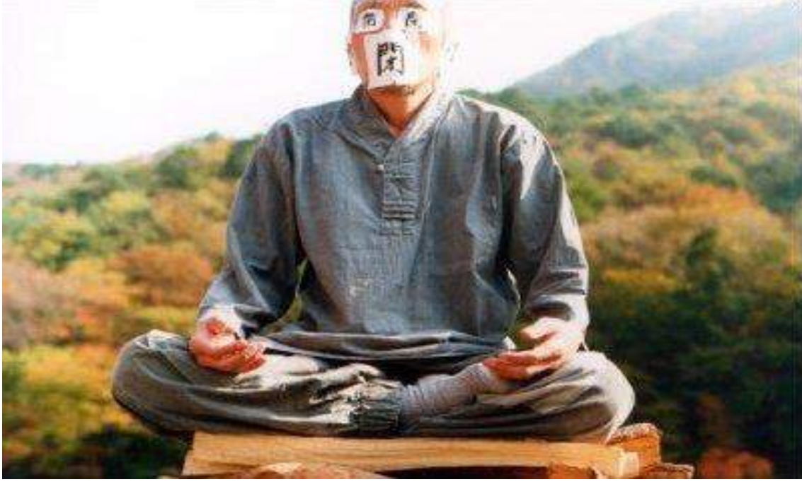
İlkbahar, Yaz, Sonbahar, Kış ve İlkbahar (2003)

Zen Budizm'in kimi kavramlarını işlemesi nedeniyle yer alıyor. Bir polisiye. İzlemeye değer bir film, fakat o kadar üst düzey değil. Çiçekli Vadi yeniden dirilme ve canın sürekli, bedeninsiz geçici olması gibi Budist izlekleri konu ediniyor. Doğrudan Budizm'i işlemese de, izlekleri dolayısıyla seçkimizde kendine yer buluyor. Zen: Zen Ustası Dogen'in Yaşamı , klasik bir Budizm filmi. Bir Zen ustasının yaşamı anlatılıyor. Sıkıyor, izlemeye değer. Özellikle ölüm ve kabullenme kavramlarının işlenmesi dolayısıyla öne çıkan bir yapım.