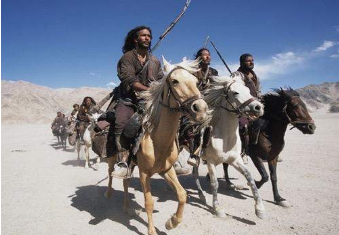
Çiçekli Vadi (2006)

Hintli bir yönetmenin çektiği bağımsız bir yapım olan film, doğrudan Budizm'i işlemiyor, ancak yeniden dirilme gibi Budist izleklerin peşine düşüyor. Filmin ilk bölümü, 19. yüzyılda Himalayalar ve çevresinde geçiyor. Geçimini yol kesmekten sağlayan eşkıyaların başı, bastığı kervanda çok güzel bir kızla karşılaşır. Birbirlerine aşık olurlar, birlikte nice maceralara atılırlar. Birbirlerine o kadar bağlanırlar ki, eşkıya başı sonunda yoldaşlarıyla ters düşer ve onlardan ayrılır. Sonunda baş-eşkıya ölümsüz olurken, insandıışı farklı bir varlık olduğu hissedilen (belki bir peri) kızı kaybeder. Filmin ikinci bölümüne geçeriz.