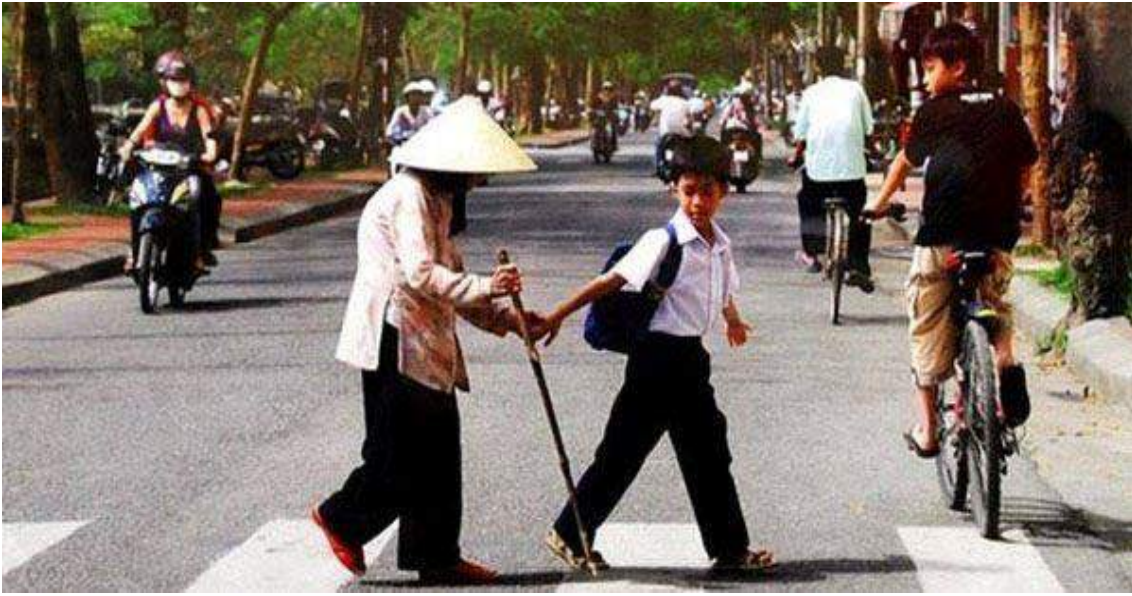
Olması Gerektiği Gibi Yaşamak

Filmin açılışı Budist anlamda ‘acı’ kavramıyla yapılır. Kanserden kaybettikleri kameraman arkadaşlarının yıldönümünde mezarını ziyaret ederler; sonra kaybettikleri çalışma arkadaşlarını anarlar. Kameraman arkadaşlarının hastalıkla geçen son iki yılını kameramanın isteğiyle kayıt altına almışlardır. O kaydı izleriz; hasta yatağından bize kitap okur meslektaşları. Sonra geleneksel cenaze töreni. Budizm’deki süreksizlik ( impermanence ) kavramı vurgulanır. Vasiyeti arkadaşlarının bir araya gelip acı üstüne bir film çekmeleridir; “Çekmezseniz...” der, “...yerin altından sizi aşıya çekerim.”. Bu film düşüncesi öyle çıkar.