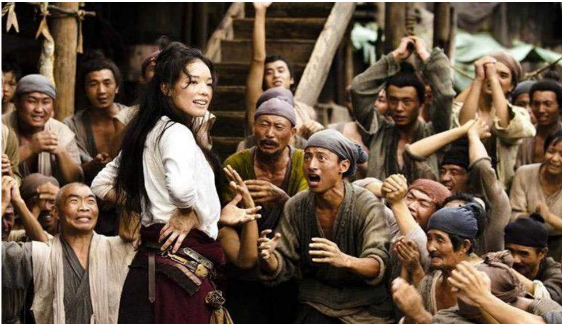
Batıya Yolculuk (2013)