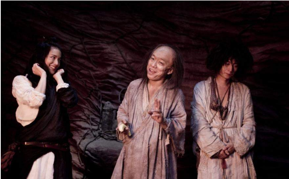
Batiya Yolculuk (2013)

Başkişisi/Başkişileri ya da Ana Kişilikleri Budist Rahip(ler) Olan Filmler (Buda dahil): Siddharta (1972), Transgression (1974), Mandala (1981), Bodhi-Dharma Neden Doğuya Gitmek İçin Buraları Terk Etti?: Bir Zen Öyküsü (1989), Küçük Buda (1993), Samsara (2001), İlkbahar, Yaz, Sonbahar, Kış ve İlkbahar (2003), Zen Noir (2006), Zen: Zen Ustası Dogen'in Yaşamı (2009) ve Batiya Yolculuk (1592/2013).