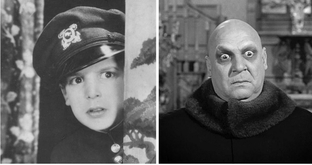
Solda: Coogan Buttons (1927) filminde, yetim çocuk Buttons rolünde Sağda: Coogan televizyon için çekilen Addams Ailesi dizisinde (1964-1966) Fester Dayı rolünde

Babası 1935'te ölünce annesi yeniden evlendi. Coogan çocuk yıldız olarak kazandığı parayı talep ettiğinde annesi ve üvey babası bunu reddetti, o da bu durum karşısında dava açtı. Hesaplanan tutar 4 milyon dolardı! O zamanki California kanunları aleyhineydi ve 1939'da ancak 126 bin dolar alabildi. Kamuoyunun sonraki tepkisi ile çocuk oyunculara ve kazançlarına güvence sağlayan, sonradan "Coogan Yasası" olarak adlandırılacak yasa çıktı. İkinci Dünya Savaşı'na katıldı ve savaştan sonra Hollywood'a döndü. Kariyerini canlandıramayınca çoğu zaman küçük ve zor rollerde görüldüğü B-filmlerinde yer almaya başladı. 1950'lerde televizyonda denedi şansını. Bundan sonrası çokça televizyon, az sayıda sinema olacaktı. 1984'te bir kalp kriziyle hayata veda etti.