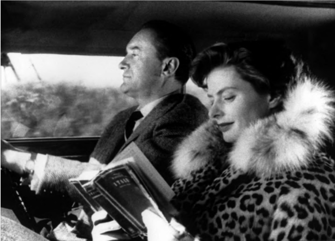
George Sanders ve Ingrid Bergman İtalya'da Yolculuk (1954)

İtalya'daki filmlerde aradığım gerçekliği buldum; ama on sene Amerika'da ve ondan önce de İsveç'te eğitim görmüştüm. Farklı şekilde çalışırdık, senaryomuz olurdu ve diyalogumuz belliydi, prova yapardık... Diyalogları kendim uydurmak ve tamamen doğaçlama olan bir sürü şey yapmak zorunda olmak hoşuma gitmiyordu. Bunu yapamıyordum. Roberto [Rossellini] da 'Her gün yaptığın konuşmalar işte. [...] Neden oturup da bunları yazayım ki ben?' diyordu. Ama yapamıyordum, ne diyeceğimi bilmiyordum. Bunu yapabilen bir oyuncu olmadığımı fark ettim.