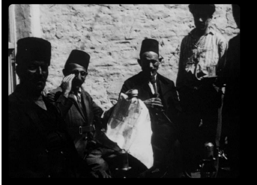
Bugün olduğu gibi, sinemanın ilk yıllarında da sinematoğrafcılardan bir selamı esirgemeyen Osmanlı vatandaşları da vardı...

HMD: Bu konuda senin bir proje yapma konusundaki hevesini kaçırdıysak gerçekten üzülürüm. Ama ne yazık ki biz bazen şöyle hatalar yapabiliyoruz: Herhangi bir konuyla ilgili çok da fazla araştırma yapmadan, ya da bazı ön kabullerden yola çıkarak projeler üretiyor ya da kesin yargılara varıyoruz. Hayatın kendisi de böyle değildir... Hepimizin başından geçmiştir, evden ekmek almak için çıkarız, dönüp gelip bir yumurta kırıp yiyeceğizdir ama ekmek almaya giderken bir arkadaşımızla karşılaşırız ve yumurta yemek için ekmek almaya giden biz kendimizi bir dönercide buluruz. Osmanlıda sinema gizli saklı bir iş değil. Bilgisi olması gereken herkesin bildiği ve bilgisinin olduğu bir şey. Ne işe yaradığını çabuk öğreniyorlar. Etkilerinin farkına çok erken varıyorlar. Sultan II. Abdülhamid , 1900'lerin başında dünya siyasetini ve olup bitenleri almak için yurtdışından film şeritleri getirtiyor. Birinci Dünya Savaşı sırasında bütün dünyada olduğu gibi Osmanlı'da da sinemanın propaganda yönü ön plana çıkıyor. Ama savaş koşullarında öykülü filmler de çekilmeye başlanıyor. Kaldı ki Türk sinemasının ilk kurumu diyebileceğimiz Merkez Sinema Dairesi, bizzat devlet tarafından kuruluyor. Dolayısıyla gizli saklı bir şey yok. Ama Osmanlı da diğer birçok devlet gibi sinemaya karşı mesafeli... ama neyine mesafeli; onun kendisine karşı kullanılacak zararlı etkilerine ve propaganda yönüne mesafeli... Bunu da zaten her ülkede görebilirsiniz. Bize has bir durum değil.