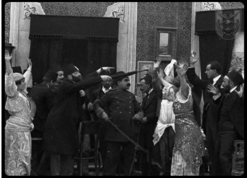
İlk Türk komedi filmlerinden Bican Efendi serisine ait Bican Efendi Vekilharç filminden bir kare