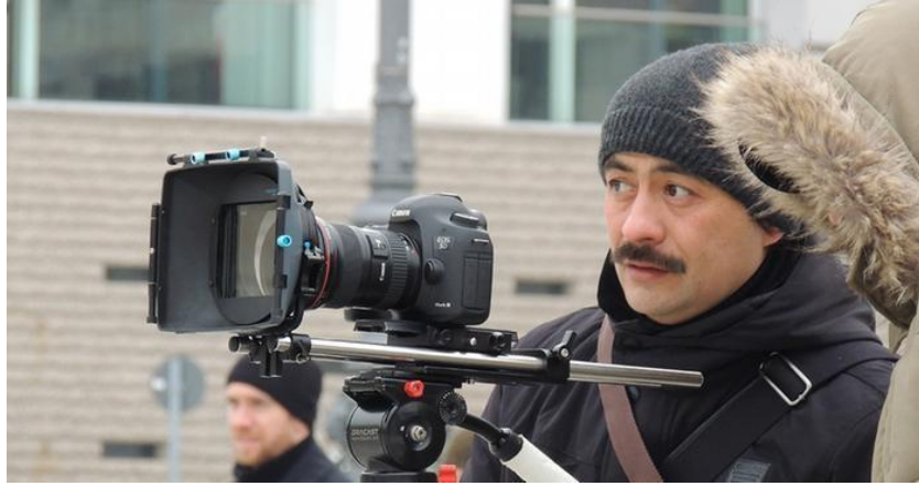
Yolkin Toychiev - (d. 1977) - Kar Koynunda Lale

Özbek düğününde kız evinde nikah kıyıldıktan sonra, damat ile gelin evden çıkmak üzere iken kızın anne babası genelde şu duayı yapar: 'Yavrum, gittiğın yerde aziz ol, taş gibi kal, gözün yaş görmesin, verdiğim tuzuma razıyım, haydi mutlu ol!' (Osmonova, 2015: 114)