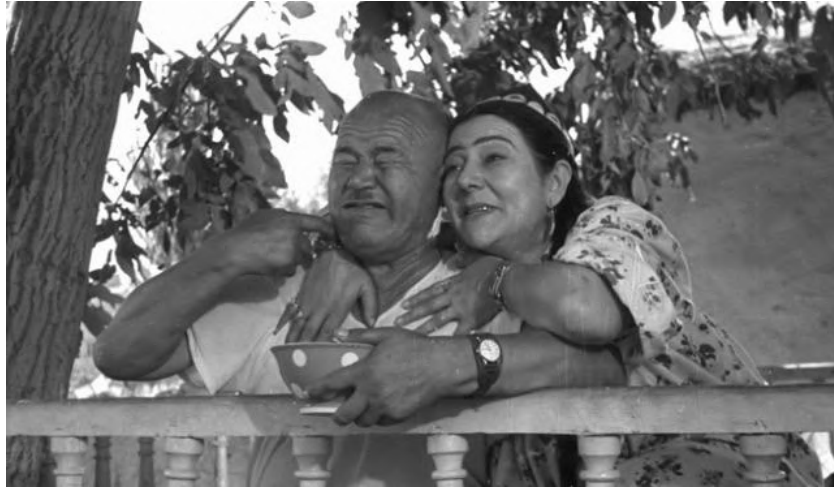
Bütün Mahalle Bunu Konuşuyor

1960'lı yılların sinema gelişiminde ana eğilim, insanın iç dünyasına olan ilgi olmuştur. Eğilimin temeli sinemanın edebiyatla kurduğu ilişkiyle alakalıdır. Bu yıllarda çekilen çoğu film, konu olarak emek ve işçi sınıfını ele almıştır. O zamanlardaki Özbek kültürünü en güzel şekilde yansıtan, Şurhat Abbasov 'un Bütün Mahalle Bunu Konuşuyor ( Mahallada Duv-Duv Gap , 1960) adlı filmi çok ün kazanmıştır.