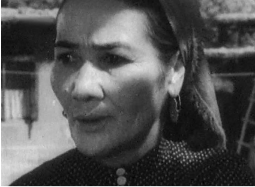
Bütün Mahalle Bunu Konuşuyor

Sayyora'yı gelin kılmayı düşünür. Umar'ın annesi de Sayyora'yı gelin kılmak ister. Umar ise Umida isimli başka bir kıza aşıktır. Ortalık karışır. Umar'ın annesi büyük bir düğün yapar. Bütün mahalleyi davet eder. Umar annesinin tercihiyle komşusunun kızıyla evlenmek zorunda kalır. Damat düğüne yalnız gelir, gelini sorduklarında ise kaçtığını söyler. Annesi çok mahcup olur. Düğüne o kadar masraf yapmışken çabası boşuna gitsin istemez. Kızın anne babasına 'Gelinimi hemen bulun.' diye baskı yapar. Gelinin anne babası da bu durumda bir şey yapamazlar. Sonra 'Hemen başka bir kız bul.' der oğluna. Umar da bu sözü bekler zaten. Düğüne onun sevgilisi de gelmiştir. Annesine sevdiği kıızı işaret ederek 'O kızla evlenmek istiyorum.' der. Aslında bu Umar'ın komşu kıızı ve arkadaşlarıyla uygulamış olduğu bir oyundur. Umar'ın başka kıızı sevdiğini bilen komşu kıızı senaryoyu kabul eder. Sonunda Umar sevdiği kıızı ile evlenir. Bütün mahalle bunu konuşur. Düğünde şarkılar söylenir, milli çalgılar çalınır, düğün çok eğlenceli geçer.