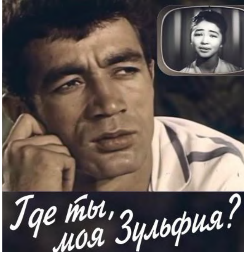
Yar Yar (1964)

izleyerek Özbek kızlarının dansının bir parçasını izlemiş ve milli kıyafetlerini görmüş oluruz. Yine Ali Hamraev 'in 1966'da beyaz perdeye çıkmış olan Beyaz Beyaz Leylekler ( Oppoq Laylaklar ) filmi de Özbek halkının hayatını, gelenek ve göreneklerini ele almış; kendine özgü bir drama kurulmuştur.