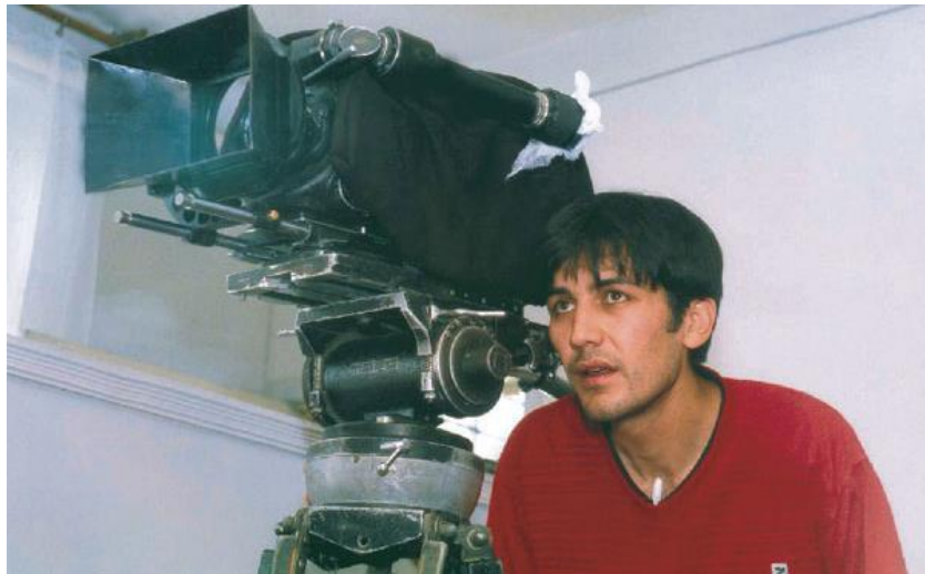
Ayub Shahobiddinov - (d. 1977 - ) - Kar Koynunda Lale

Özbek Türklerinin kültürünü yansıtan önemli filmlerden biri de Kar Koynunda Lale ( Qor Qo'ynida Lola , 2003) isimli filmidir. Yönetmenliğini Ayub Shahobiddinov ve Yolkin Toychiyev 'in yaptığı film, Abdulhamid Çolpon 'un yazdığı aynı adlı hikayeden uyarlanmıştır. Film, 1923'lerdeTürkistan'da yaşayan bir ailenin geçirdiği günleri anlatır. Kültür olarak o dönemdeki yaşamı, halkın giydiđi kıyafetleri, düğündeki örf-adetleri bu filmde de görmek mümkündür.