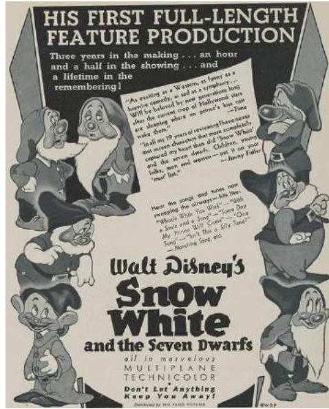
Pamuk Prenses ve Yedi Cüceler (1937)

Ama oradaki kalabalık da ne? Ellerinde pankartlar, pankartlarda Walt Disney 'in sevilen kahramanları, Miki'ler, Pinokyo'lar Dumbo'lar... kızgın ifadelerle çalışma şartlarından şikâyet ediyorlar. Profesyonel sanatçıların protestosu böyle oluyor! 2