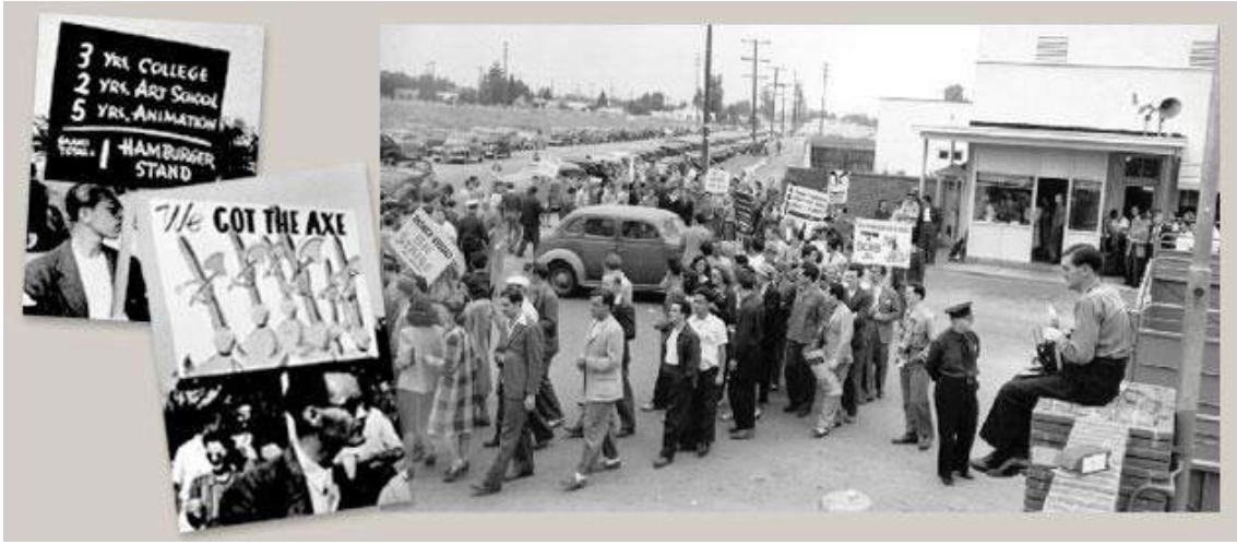
1941 Disney Grevi