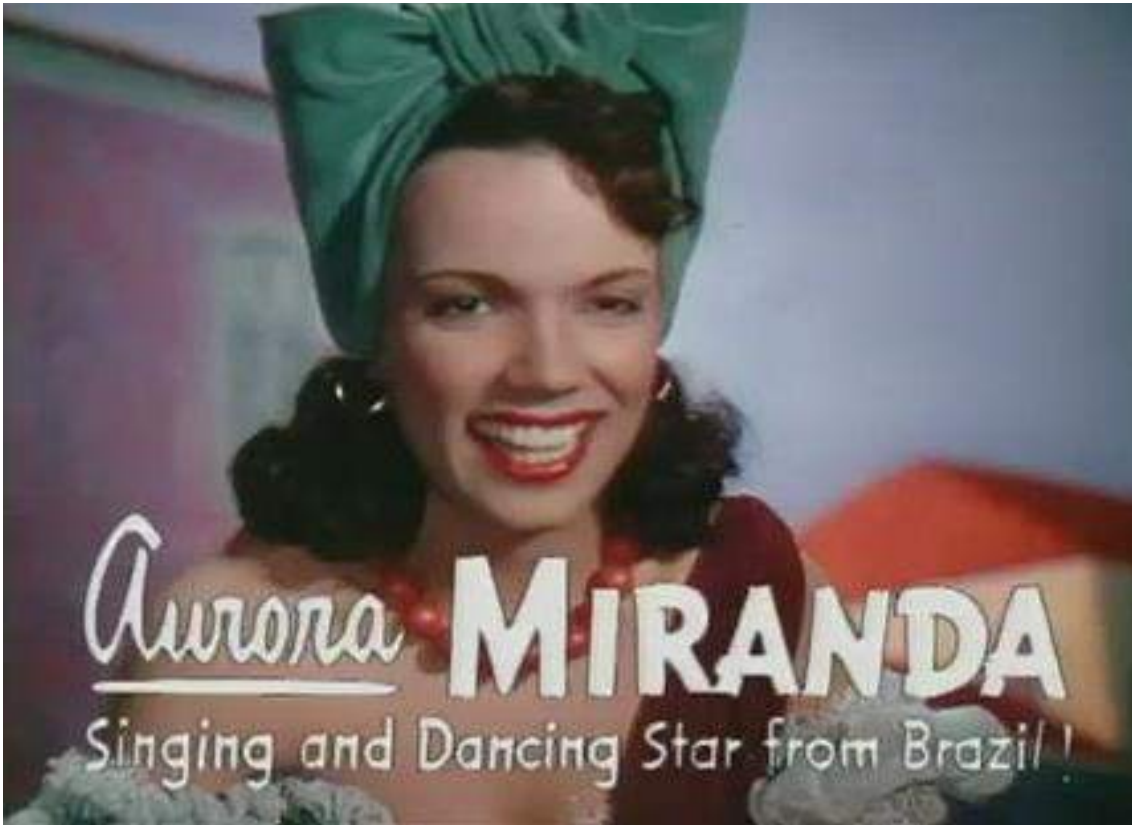
Üç Kafadar (1945)

1945'te çıkan ikinci film dilimize Üç Kafadar olarak tercüme edilen The Three Caballeros 'tur ve ilkinden daha uzun ve daha yoğundur. Bu filmde Donald iki arkadaş edinir; Brezilyalı papağan José Carioca (Hose Karioka) ile Meksikalı horoz Panchito (Pançito); beraberce filme adını veren "Üç Kafadar"'ı oluştururlar.