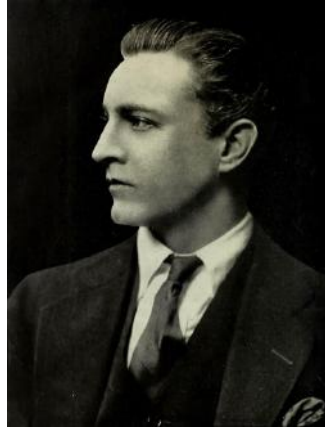
Oscar Heykeline de ilham veren John Barrymore

Hem Jekyll'ı hem de Hyde'ı büyük bir yetkinlikle canlandıran Johnny Barrymore (1882-1942), genç yaşta başarıyı yakalayıp da Hollywood'un en trajik düşüşlerinden birini yaşayan bir yıldız. Amerika'nın en ünlü tiyatrocusu ailesinden gelen aktörün hakiki soyadı Blyth iken sahne adı olarak Barrymore'u kullanmaktaydılar. Annesi Georgie Drew de (ki torun Drew Barrymore da ileride büyük bir yıldız olacaktı) aktör Jon Drew 'ün kızıydı. Aile, çocukları John , Lionel ve Ethel 'i de oyuncu olarak yetiştirdi ve üçü de efsanevi yıldızlar oldular. John yakışıklı, gösterişliydi. Babasının yapımlarından birinde, 18 yaşında sahneye çıktı, ama ressam olmakla daha fazla ilgiliydi.