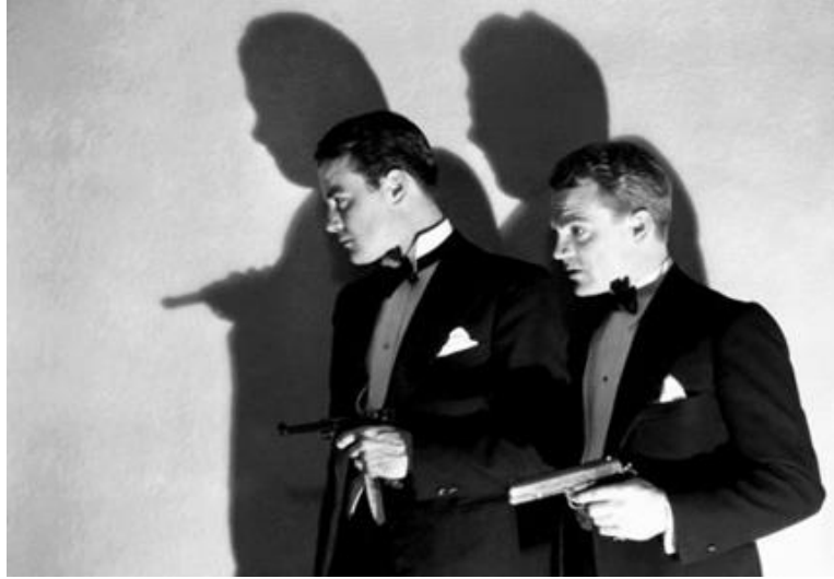
Doorway to Hell

Doorway to Hell (Archie Mayo, 1930) filminde genç ve acımasız çete lideri Louie Lamarr, gazetelerde “yeraltı dünyasının Napolyon”u şeklinde anılır. Filmde Louie'nin tekinsiz kariyerinin son yıllarına odaklanılır. Karanlık işlerden zengin olan çete lideri, Doris adlı genç bir kadınla evlenerek emekli olur; otobiyografisini yazmak ve golf oynamak için Florida'ya yerleşir. Öte yandan Chicago'da sular durulmaz ve Louie'nin şehre dönmesi için planlar yapılmaya başlanır. Erkek kardeşinin düşmanları tarafından kaçırılması ve ölmesi, Louie'nin arkasında bıraktığı suç dünyasına dönmesine sebep olur. Filmin isminden de anlaşıldığı gibi bu dünyanın tek kapısı vardır, o da cehenneme açılmaktadır.