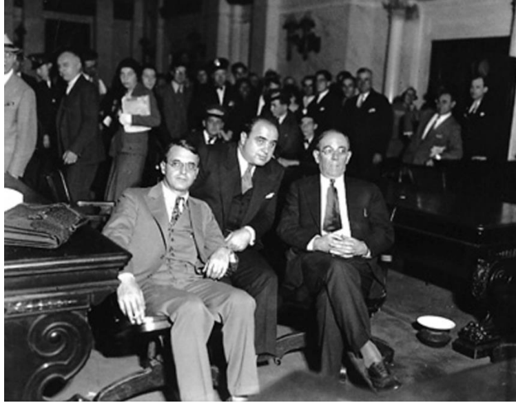
Al Capone (ortada)

Kamuoyunun tepkisini çeken film, pek çok eyalette gösterilemez ya da gösterime geç girer. Bu nedenle filme yeni sahneler ve ön jeneriğine bir yazı eklenir: “ Bu film ABD’deki çete yönetimini ve hükümetin kayıtsızlığını sergileyip suçlamaktadır. Peki siz bu konuda ne yapmayı düşünüyorsunuz? ”